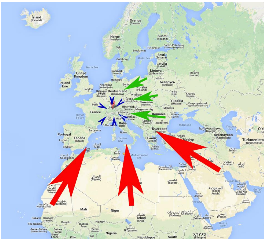
Migrationsströme in Europa

Die Wohlhabenden Länder mit guten Sozialsystemen werden überrannt. Leider hat sich gezeigt, dass die Schengen-Dublin Abkommen kaum Wirkung zeigen und Asylsuchende nicht mehr in die Eintrittsländer oder gar in ihre Herkunftsländer zurückgeschafft werden können. Man rechtfertigt die Bleibegewohnheit mit humanitärer Tradition, löst aber die Probleme nicht, welche die offenen Grenzen mit sich bringen. Besonders klar zeigen die Entscheide des Europäischen Gerichtshofs für Menschenrechte, wie naiv die Thematik behandelt wird. Selbst Migranten, welche sich gesetzeswidrig verhalten, können in den Ländern bleiben und, noch schlimmer, der EMGR schiebt sogar Drittstaaten wie der Schweiz vor, was sie zu tun haben.